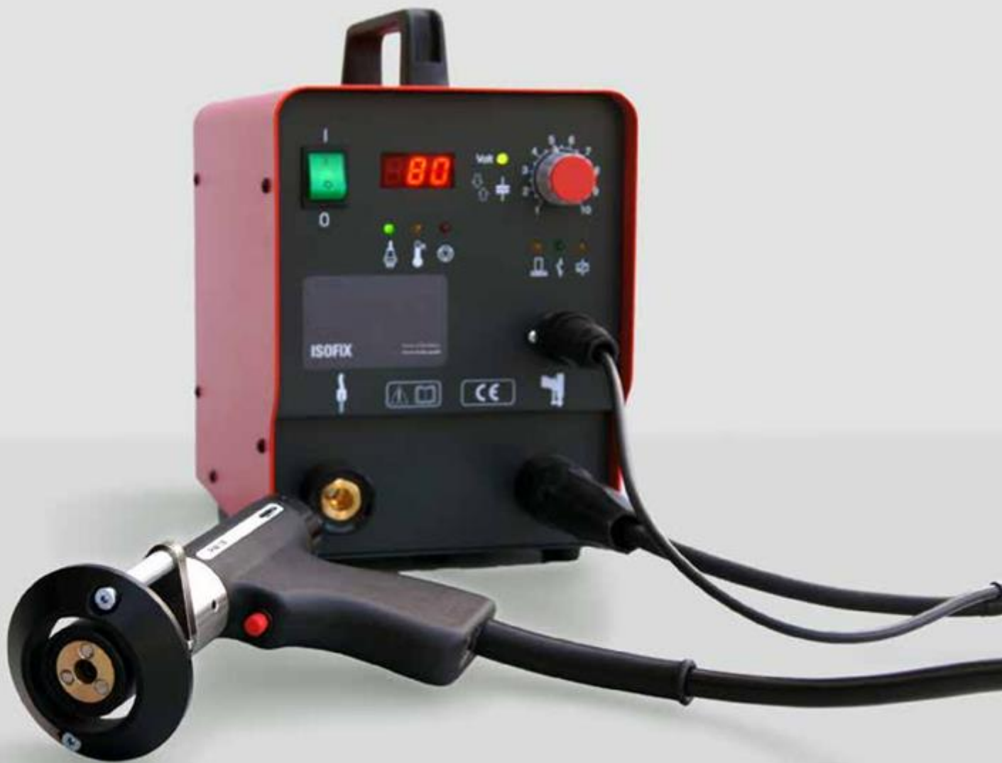
PIM-1B PISTOLA DE SOLDADURA PARA SOLDAR CLAVOS CON CLIP