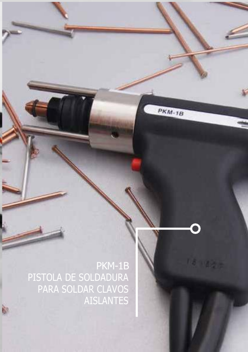
PKM-1B PISTOLA DE SOLDADURA PARA SOLDAR CLAVOS AISLANTES